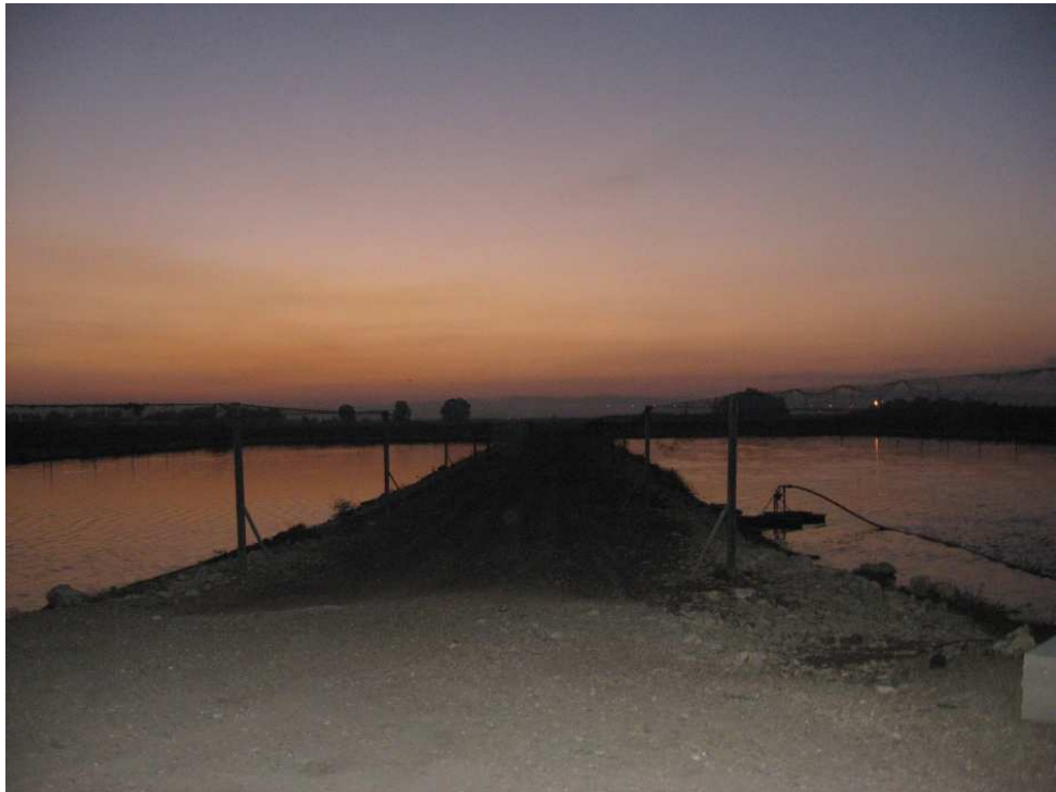
שעה : 05:15 מיקום : בריכות גן שמואל תאור : שיכוב של זיהום אוויר הנע מכיוון מזרח לכיוון מערב.