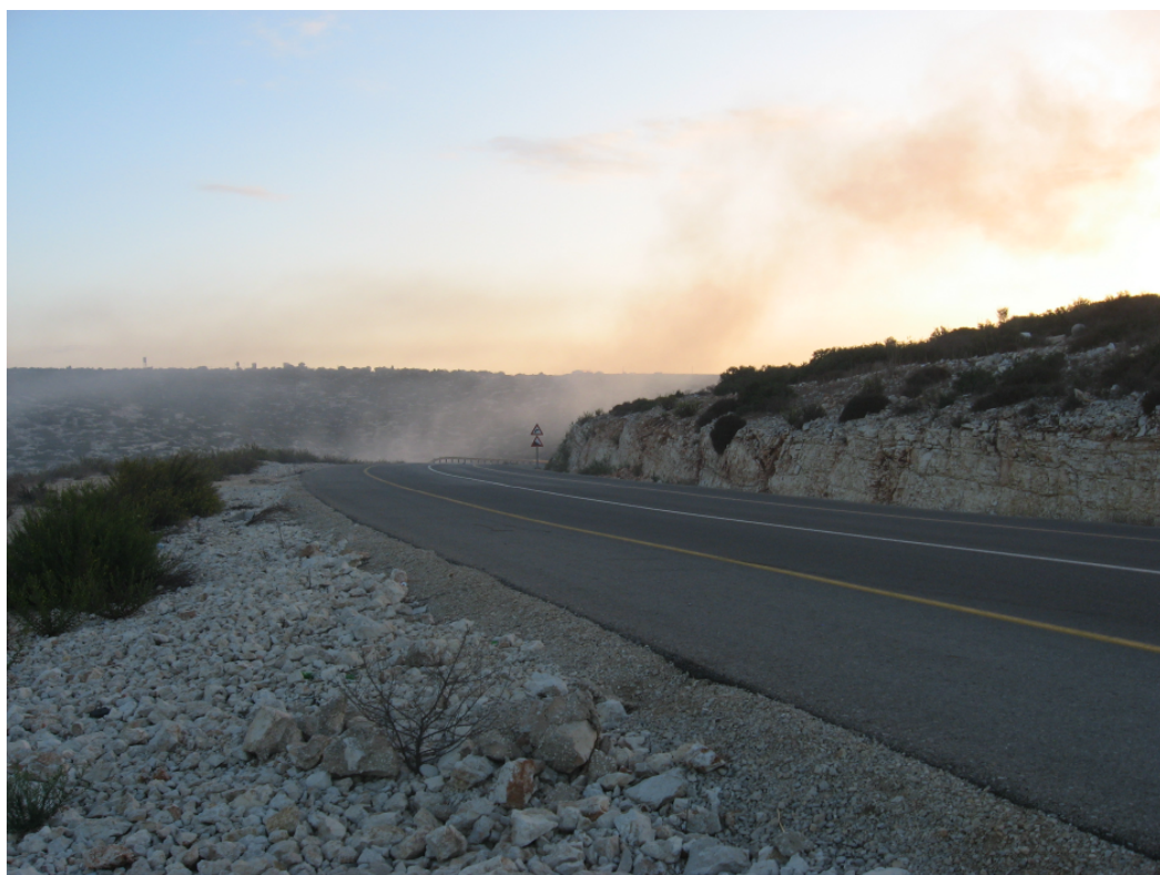
שעה : 06:10 מיקום : כביש 596 סמוך לריחן תאור : זיהום המפחמה מפזר במורד ההר לכיוון ברטעה ומצפה אילן.