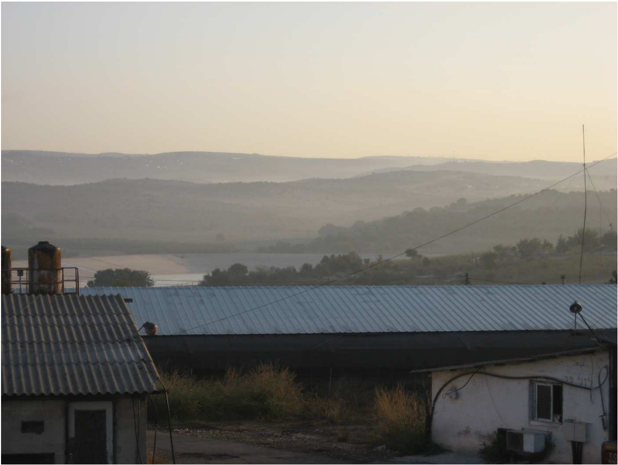
שעה : 06:40 מיקום : רפת קיבוץ מצר תאור : הוואדי אפוף בעשן המגיח מזרח