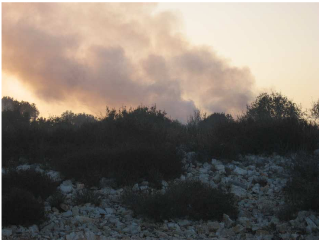
שעה : 06:05 מיקום : כביש 596 סמוך לריחן תאור : זיהום אוויר ממפחמה פעילה