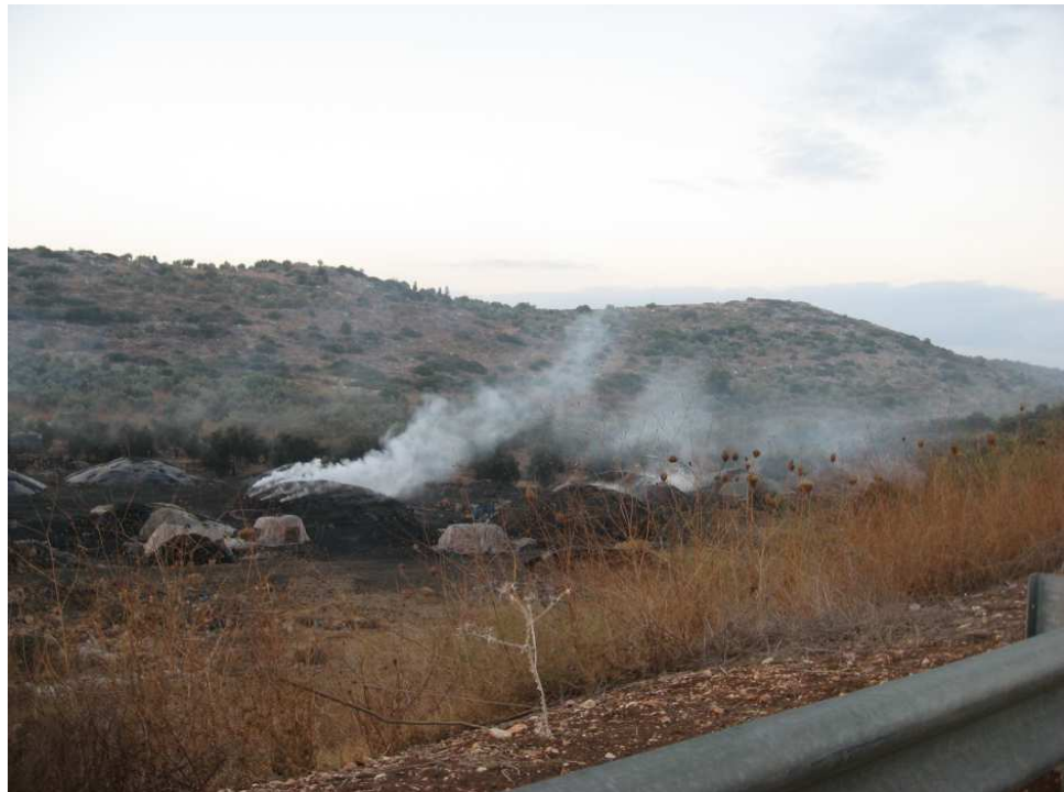
שעה : 06:00 מיקום : כביש 611 סמוך למצפה אילן תאור : חלק דרומי של מפחמת "חוסיין"